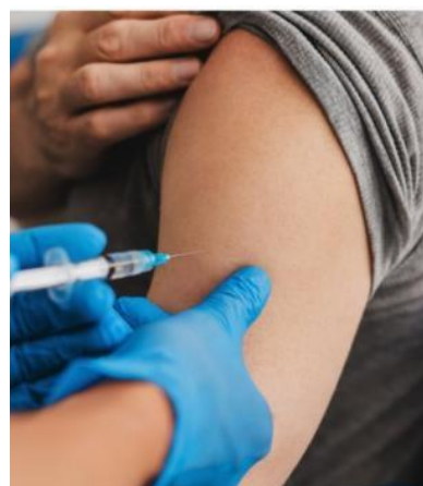
La campagne de vaccination a débuté.

la grippe et ses complications. La vaccination est un outil essentiel de prévention qui permet de réduire le risque de mortalité de 43 %, de diminuer de 20 % les infections respiratoires et de baisser de 26 % le risque d'accidents cardiovasculaires. Elle offre ainsi en complément des gestes barrières une protection précieuse contre le virus et ses complications. » ■