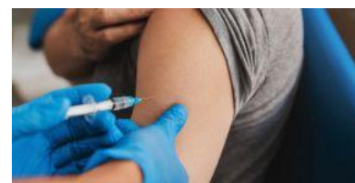
Chaque hiver, la grippe touche entre 2 et 6 millions de personnes en France.

au respect des gestes barrières. « Nous avons la chance de disposer de vaccins contre la grippe et ses complications. La vaccination est un outil essentiel de prévention qui permet de réduire le risque de mortalité de 43%, de diminuer de 20% les infections respiratoires et de baisser de 26% le risque d'accidents cardiovasculaires. Elle offre ainsi en complément des gestes barrières une protection précieuse contre le virus et ses complications. » ■