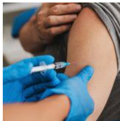
La couverture vaccinale demeure insuffisante en France.

de disposer de vaccins contre la grippe et ses complications. La vaccination est un outil essentiel de prévention qui permet de réduire le risque de mortalité de 43 %, de diminuer de 20 % les infections respiratoires et de baisser de 26 % le risque d'accidents cardiovasculaires. Elle offre ainsi en complément des gestes barrières une protection précieuse contre le virus et ses complications. » ■