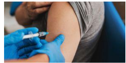
Chaque hiver, la grippe touche entre 2 et 6 millions de personnes en France.

au respect des gestes barrières. « Nous avons la chance de disposer de vaccins contre la grippe et ses complications. La vaccination est un outil essentiel de prévention qui permet de réduire le risque de mortalité de 43%, de diminuer de 20% les infections respiratoires et de baisser de 26% le risque d'accidents cardiovasculaires. Elle offre ainsi en complément des gestes barrières une protection précieuse contre le virus et ses complications. » ■