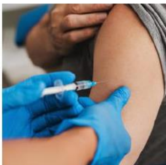
Contre la grippe, la vaccination reste un outil essentiel.